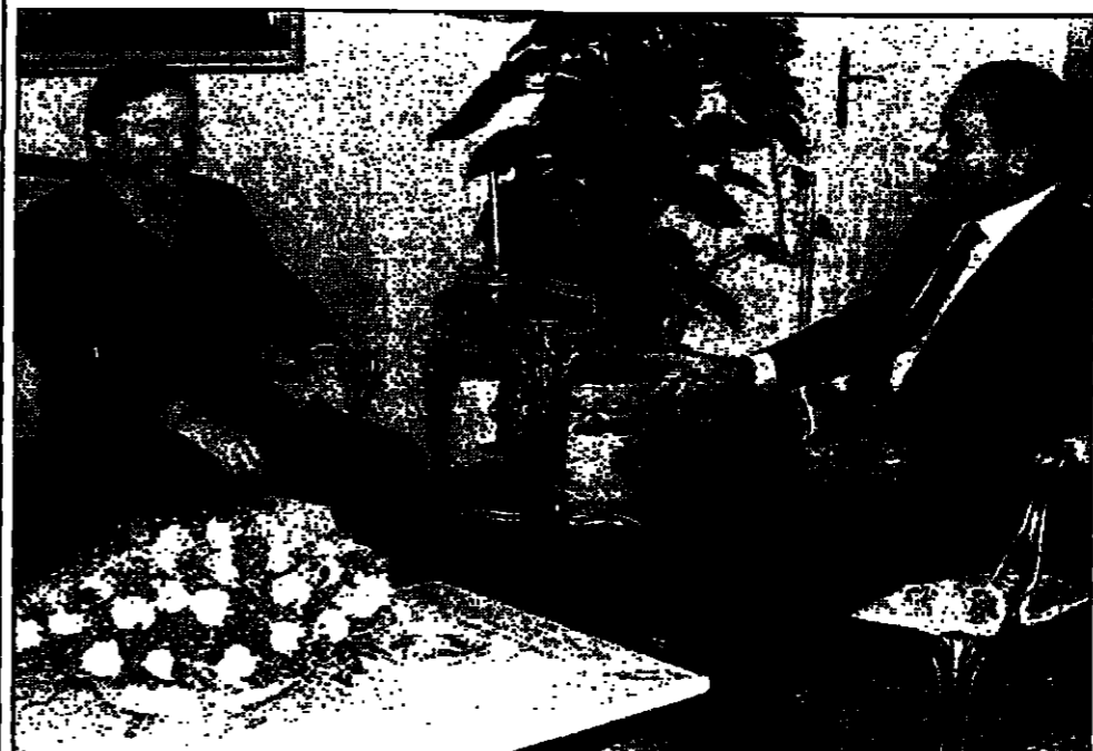
الرئيس مبارك لدى اجتماعه بنائب المستشار النمساوي أمس

القاهرة - قال وزير الخارجية النمساوي كلاوس مارتنيني في مقابلة مع صحيفة "الشرق الأوسط" إن زيارة الرئيس مبارك إلى النمسا في وقت سابق من الشهر الجاري، كانت فرصة للتعبير عن تقدير النمساويين لعملية السلام في الشرق الأوسط، وخصوصاً قرار العراق استئناف تعاونه مع مفوضية لجنة الأمم المتحدة للتحقق من أزمة الخليج (يونسكوم)، وأكد مارتنيني أن مصر والإتحاد الأوروبي جيران إسرائيل، وبالتالي فإن أي اتفاق سلام في الشرق الأوسط، يجب أن يراعي مصالحهم جميعاً، وأضاف أن مصر والإتحاد الأوروبي يتعاونان مع إسرائيل في تحقيق السلام في الشرق الأوسط، مؤكداً أن هذا التعاون يجب أن يستمر حتى يتم تحقيق السلام في المنطقة.